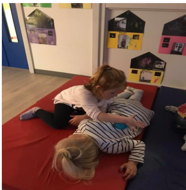
” Børnene giver hinanden massage”