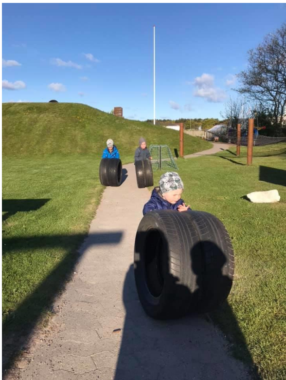
”Spontan udfoldelse af kroppen, der trilles med dæk på vores legeplads”